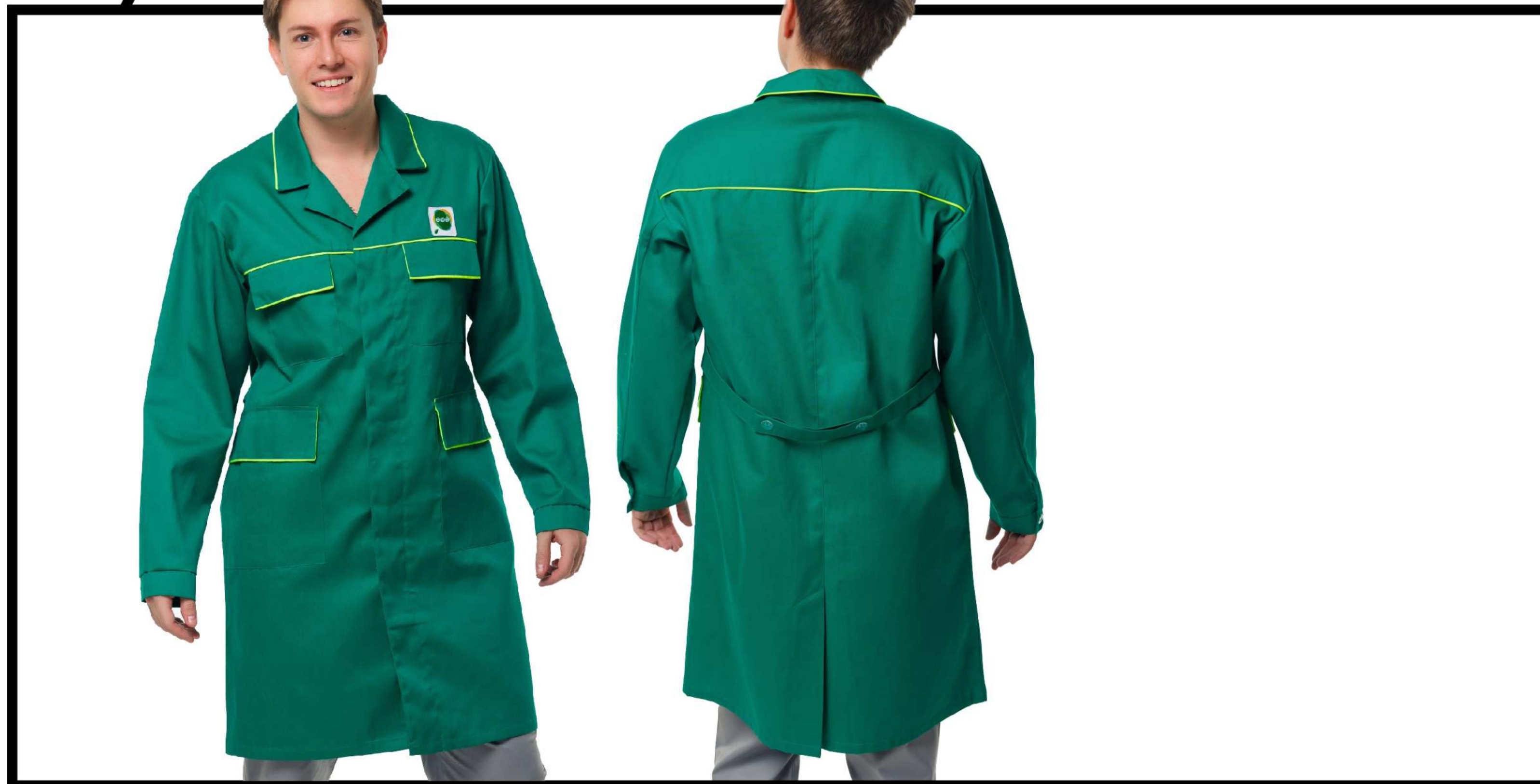
Арт. 1-18-3 Халат мужской