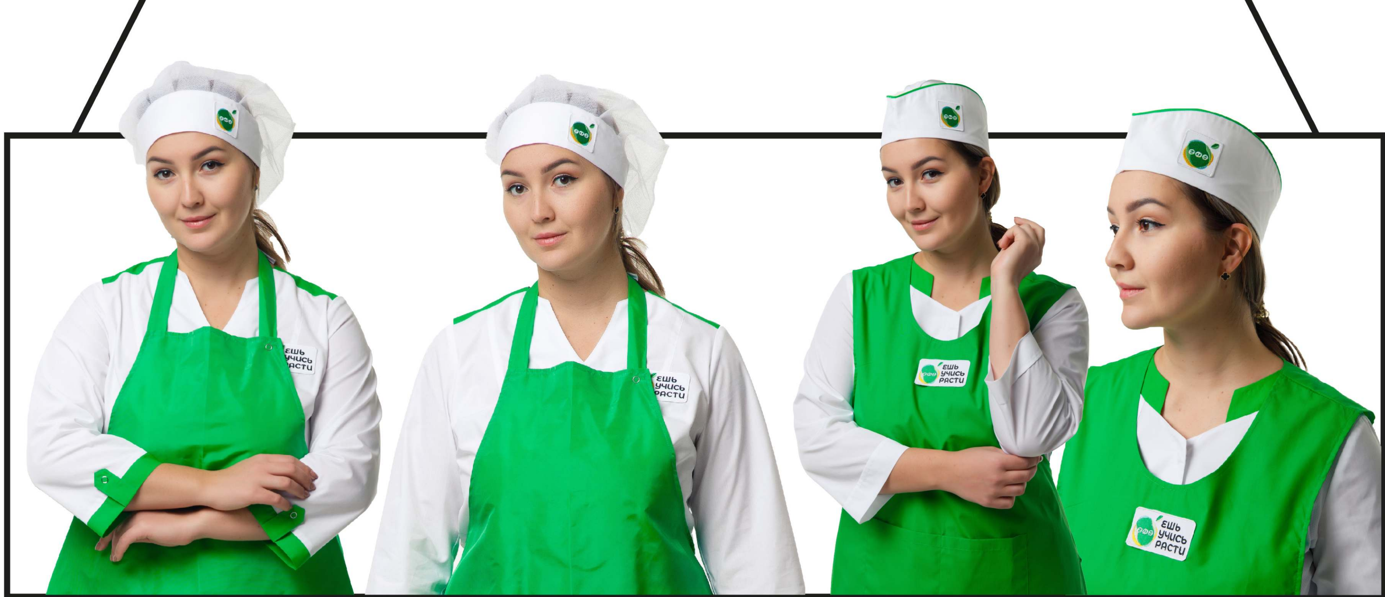
Арт. 4-17 Колпак поварской