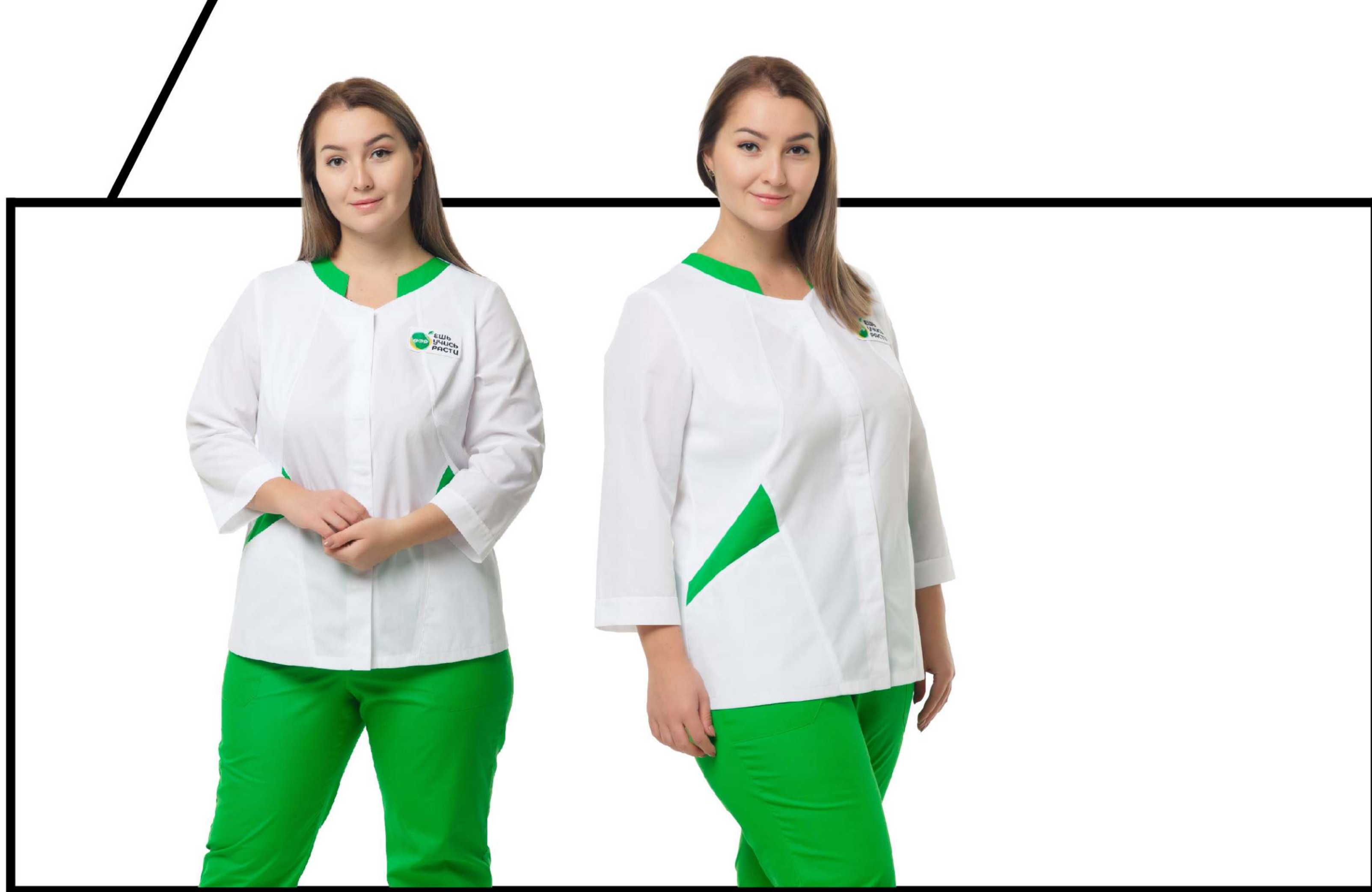
Арт. 2-862-2 Блуза женская