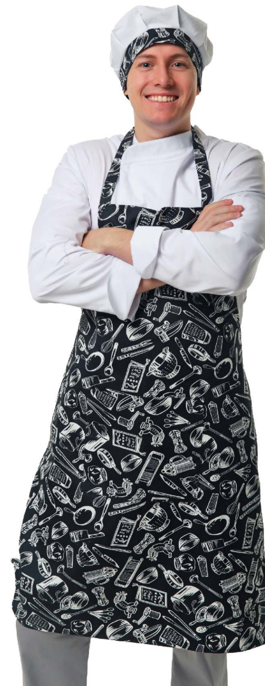
Размеры: с 44 по 54 Ткань: тиси