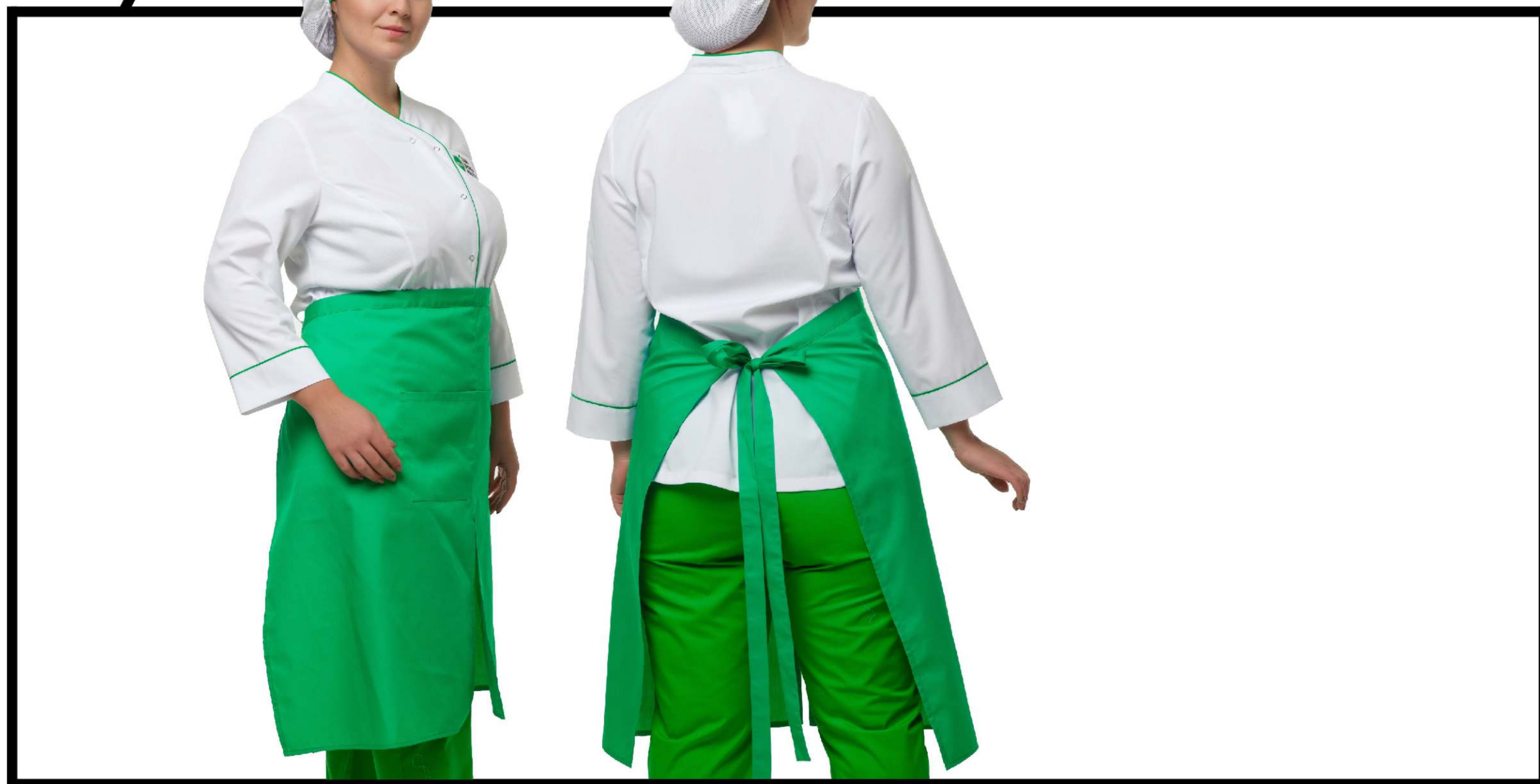
Арт. 5-356/1 Фартук на пояс