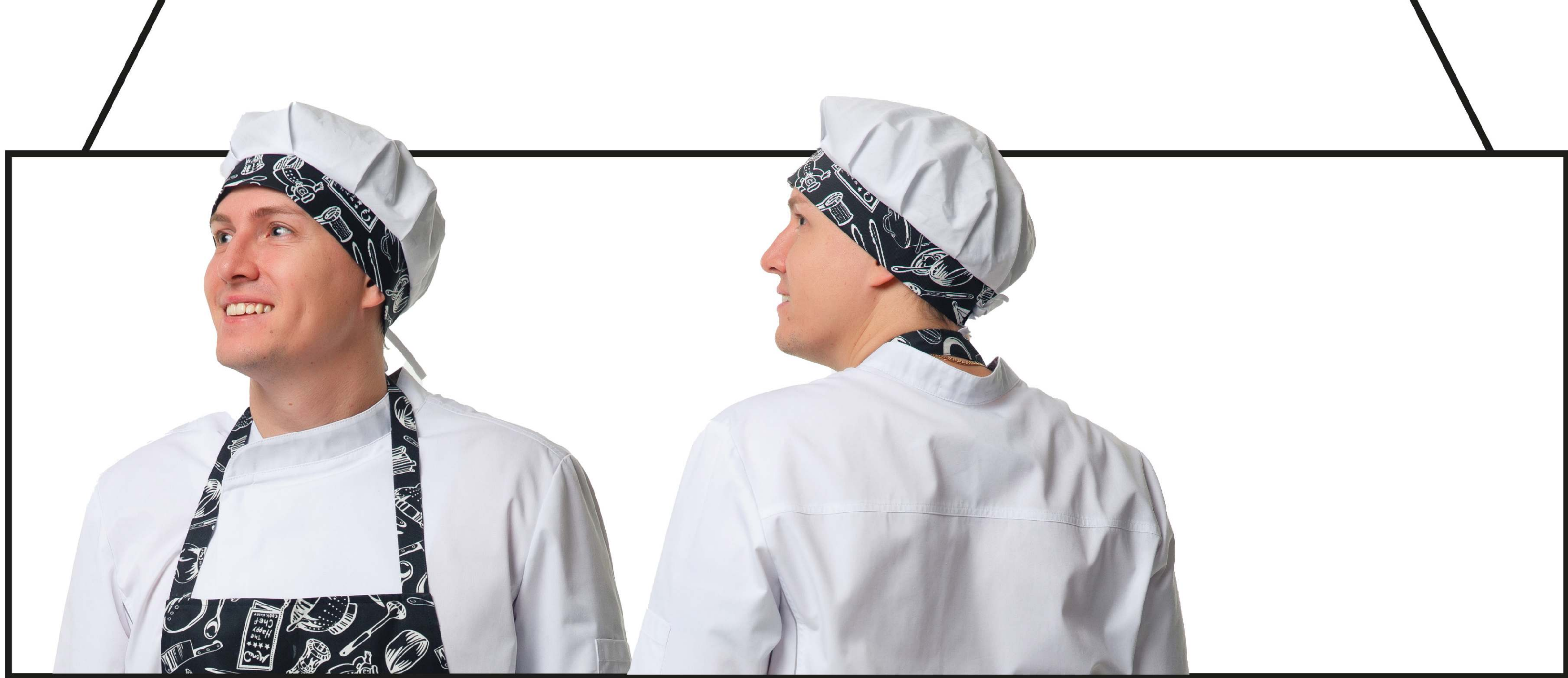
Арт. 4-221/3 Колпак поварской