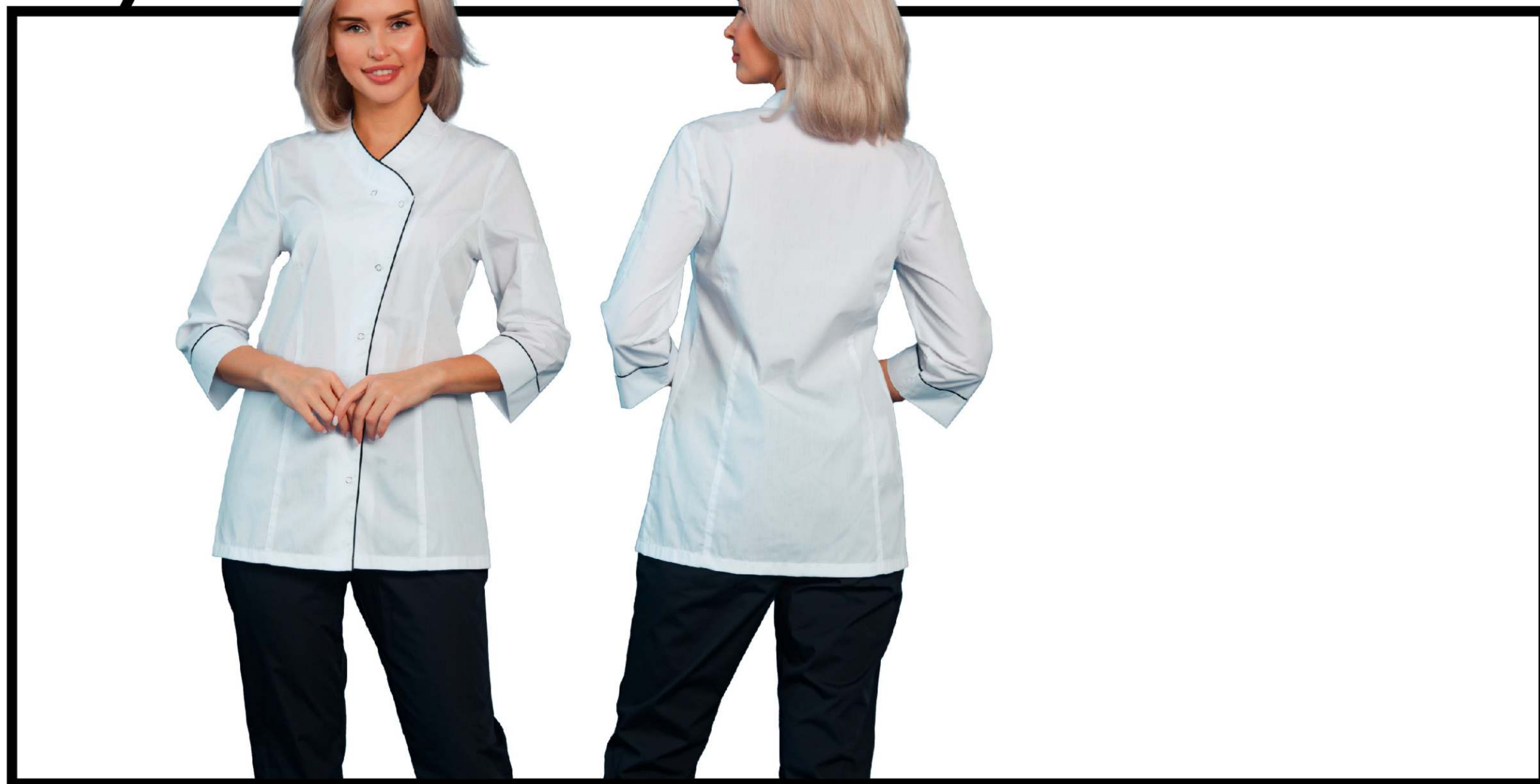
Арт. 2-696 Китель поварской