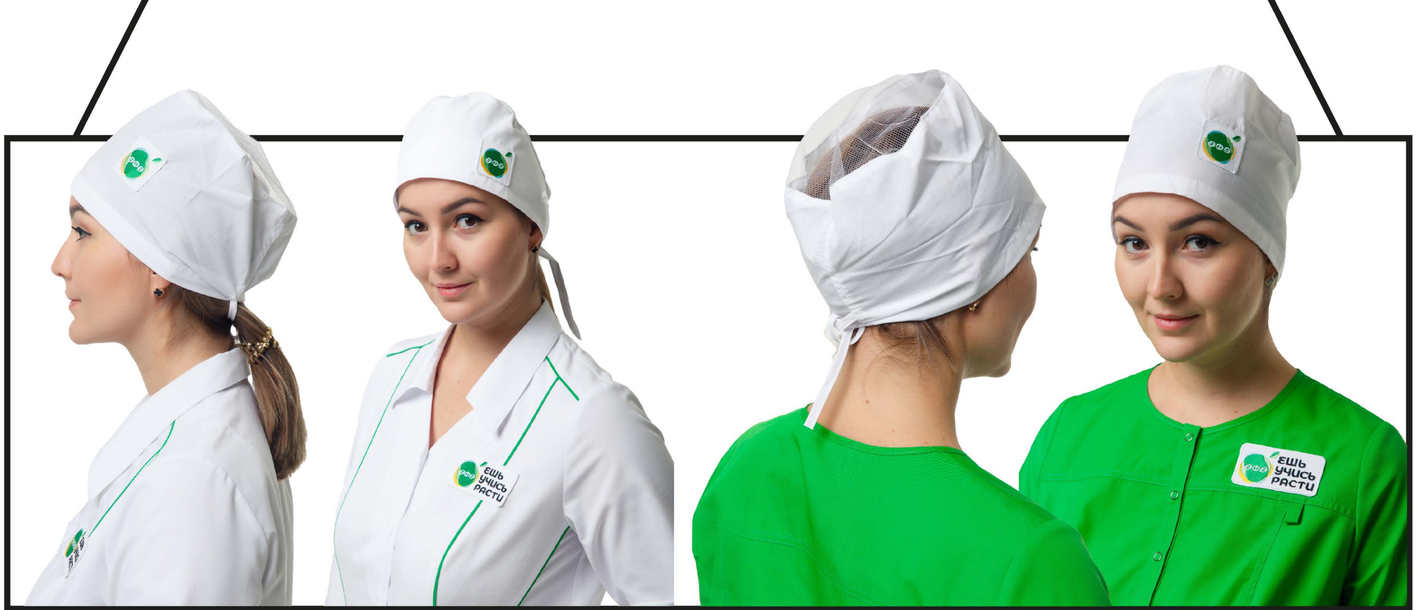
Арт. 4-22 Колпак поварской