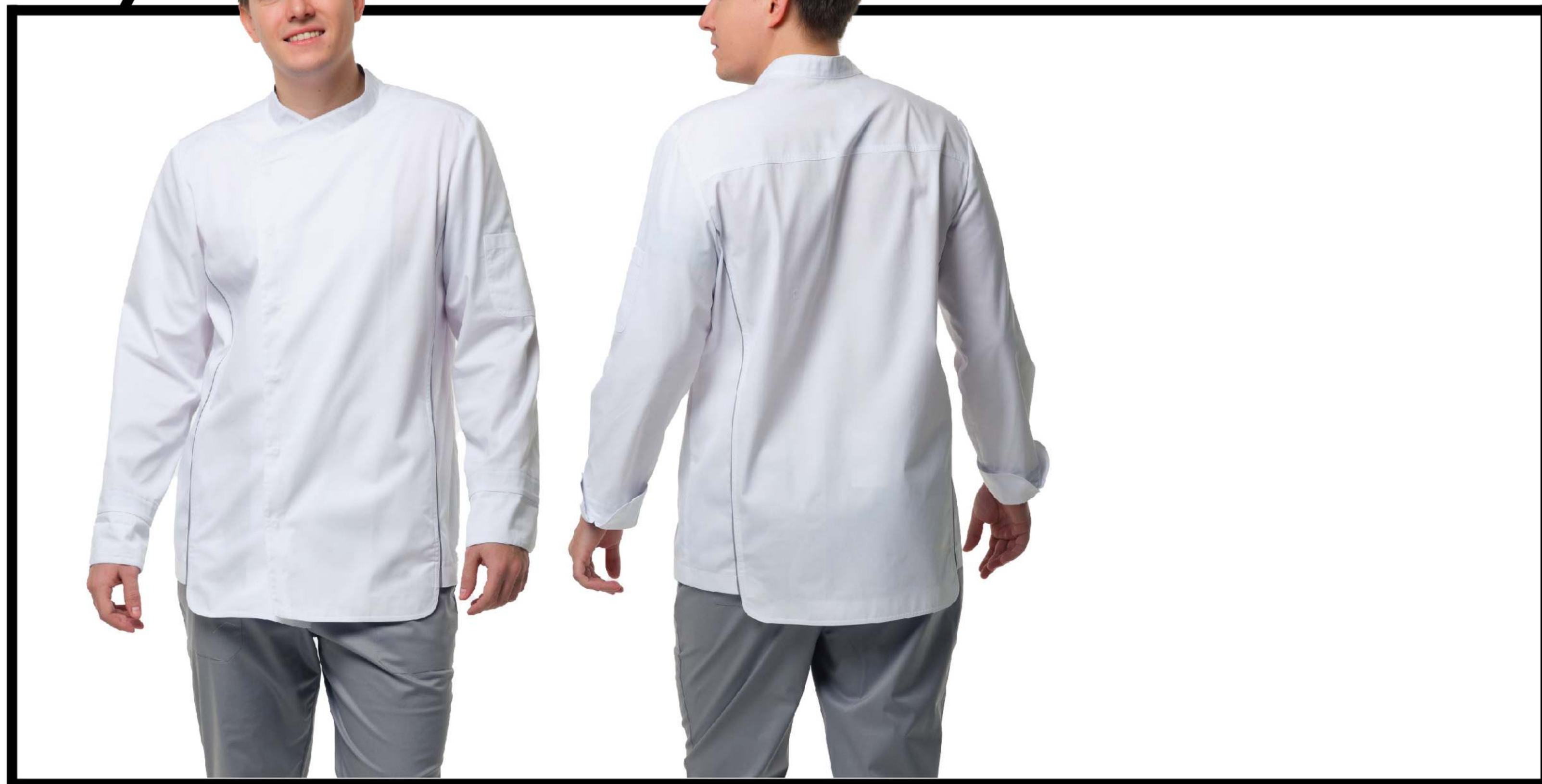
Арт. 2-643 Блуза мужская

Размеры: с 50 по 70 Ткань: сатори-стрейч, отделка вышивка