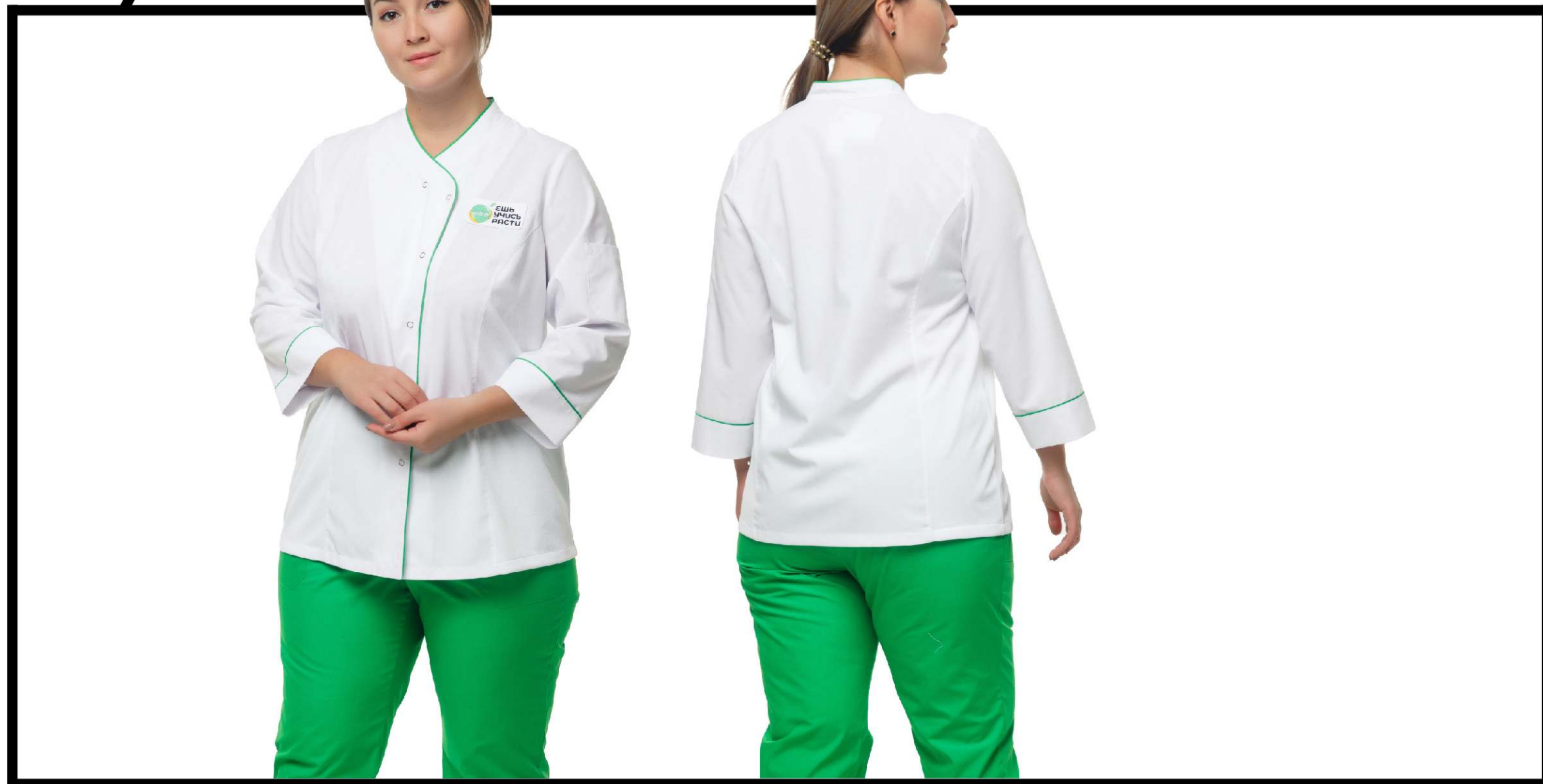
Арт. 6-696 Блуза женская

Размеры: с 44 по 64 Ткань: вискоза 35%, п/э 65%