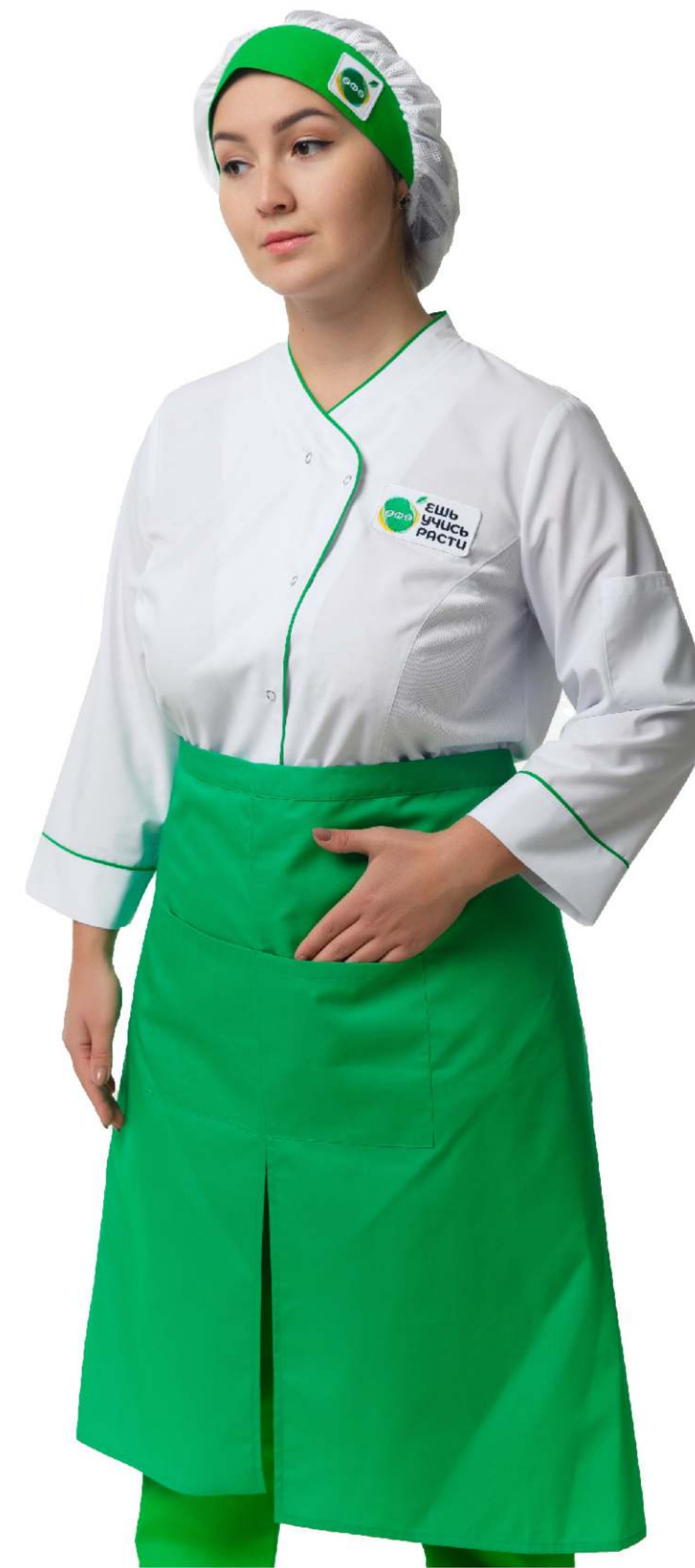
Размеры: с 40 по 48 Ткань: сатори