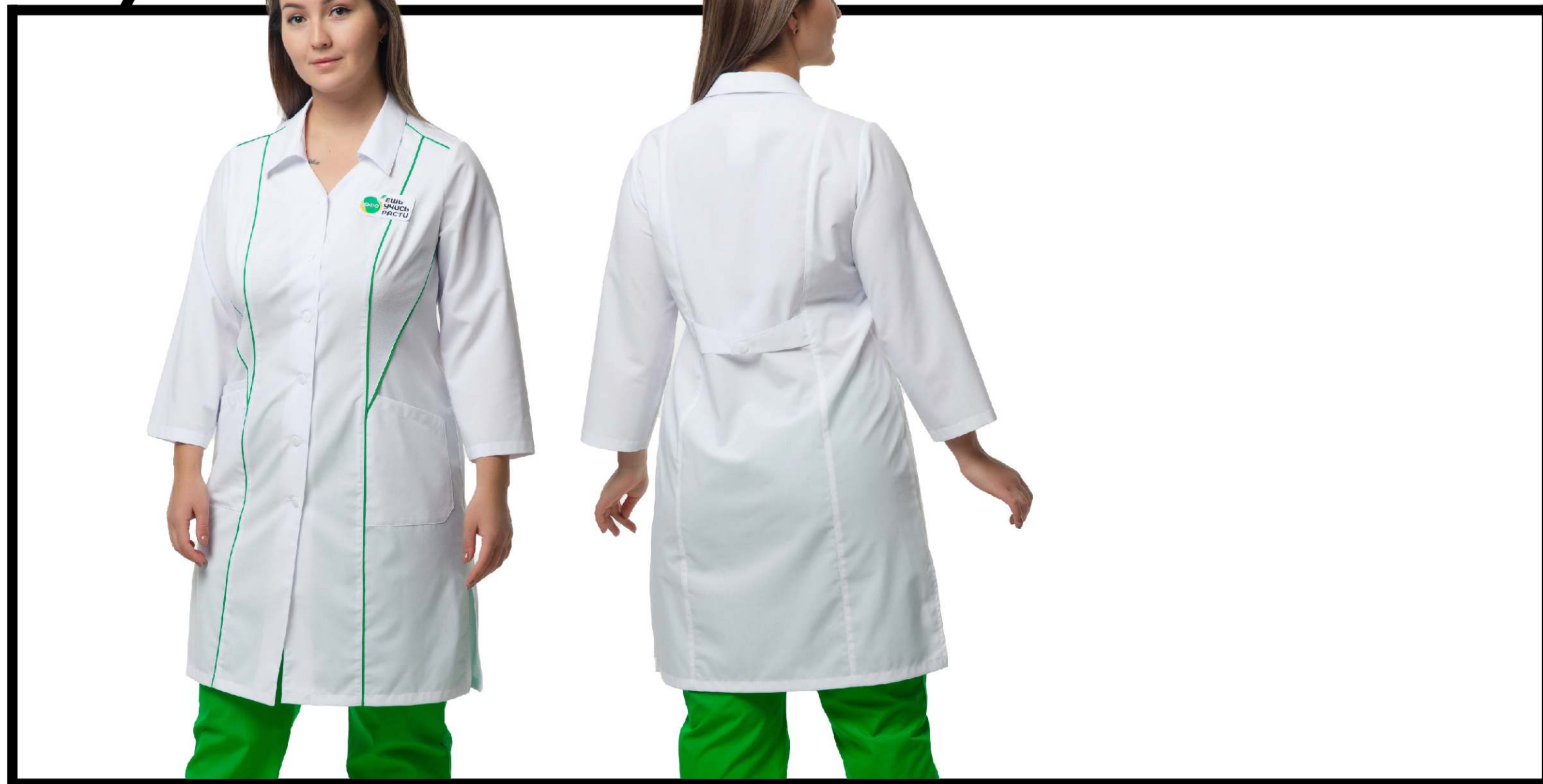
Арт. 1-585/1 Халат женский