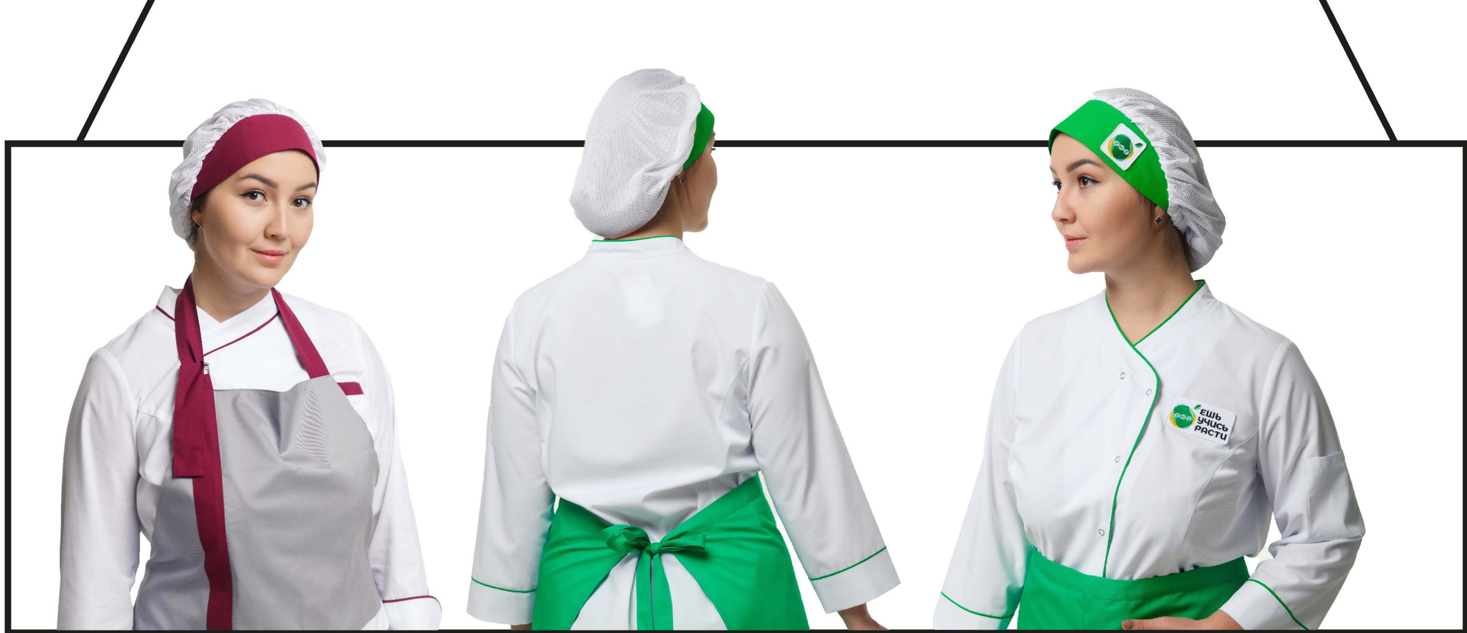
Арт. 4-856 Колпак поварской