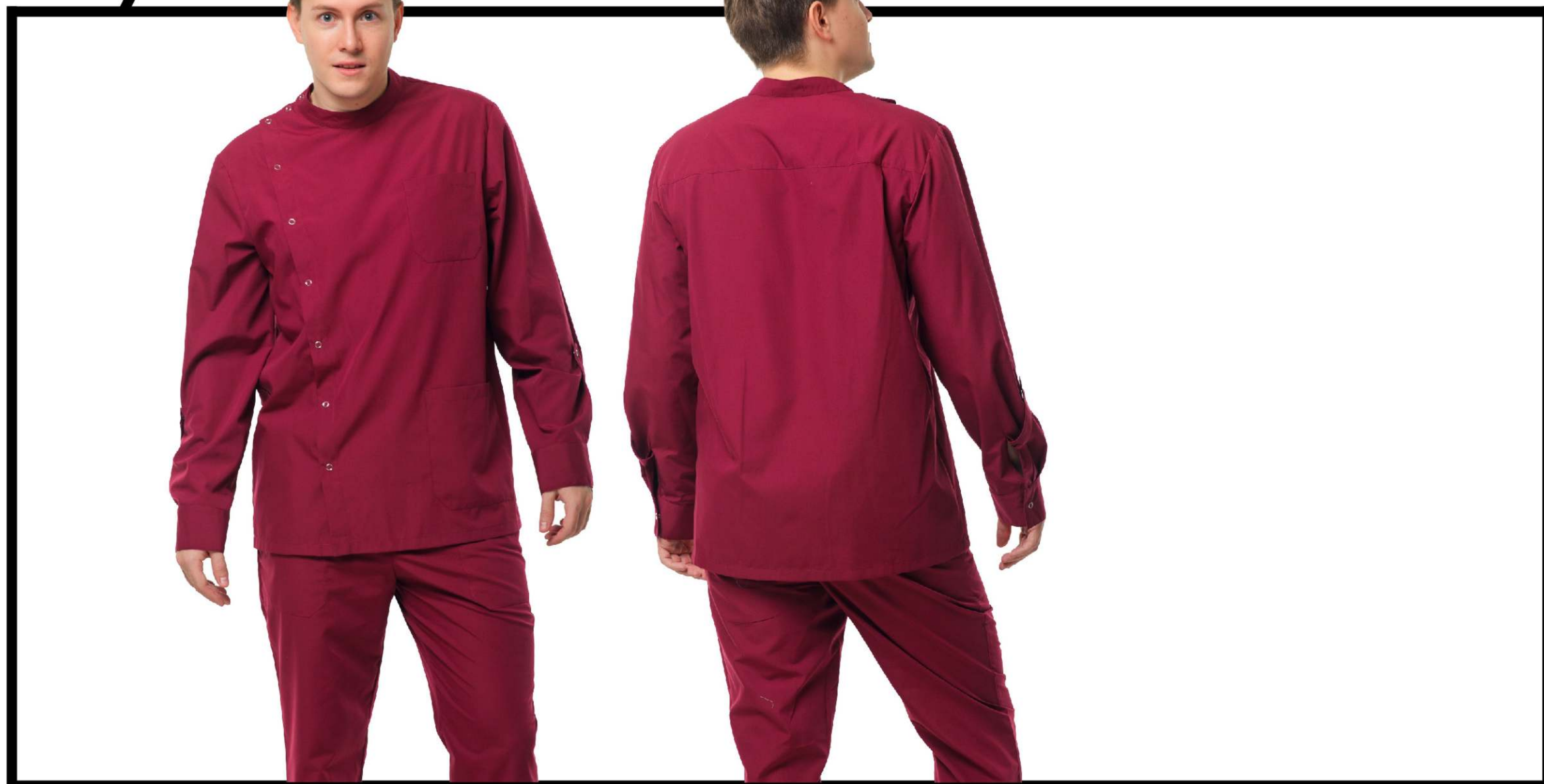
Арт. 2-818/1 Блуза мужская