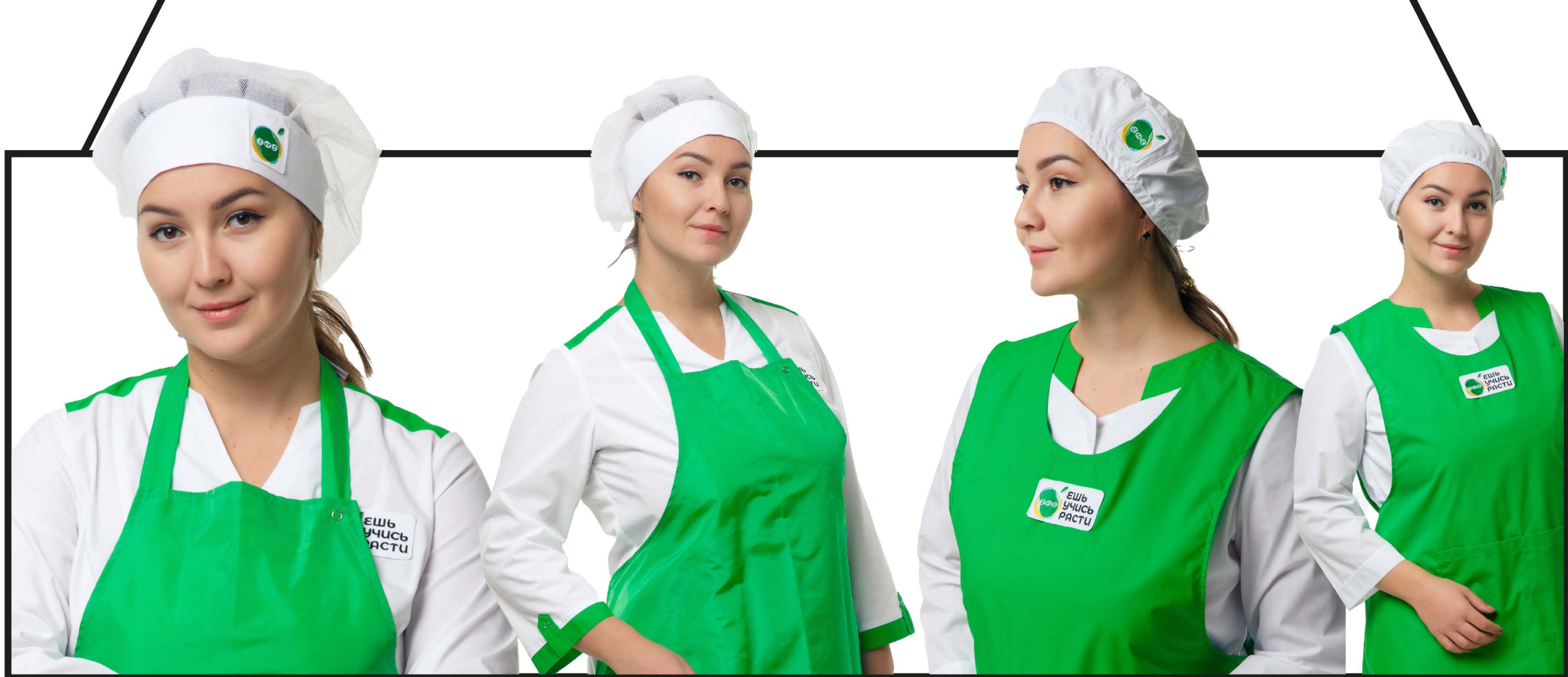
Арт. 4-17 Колпак поварской