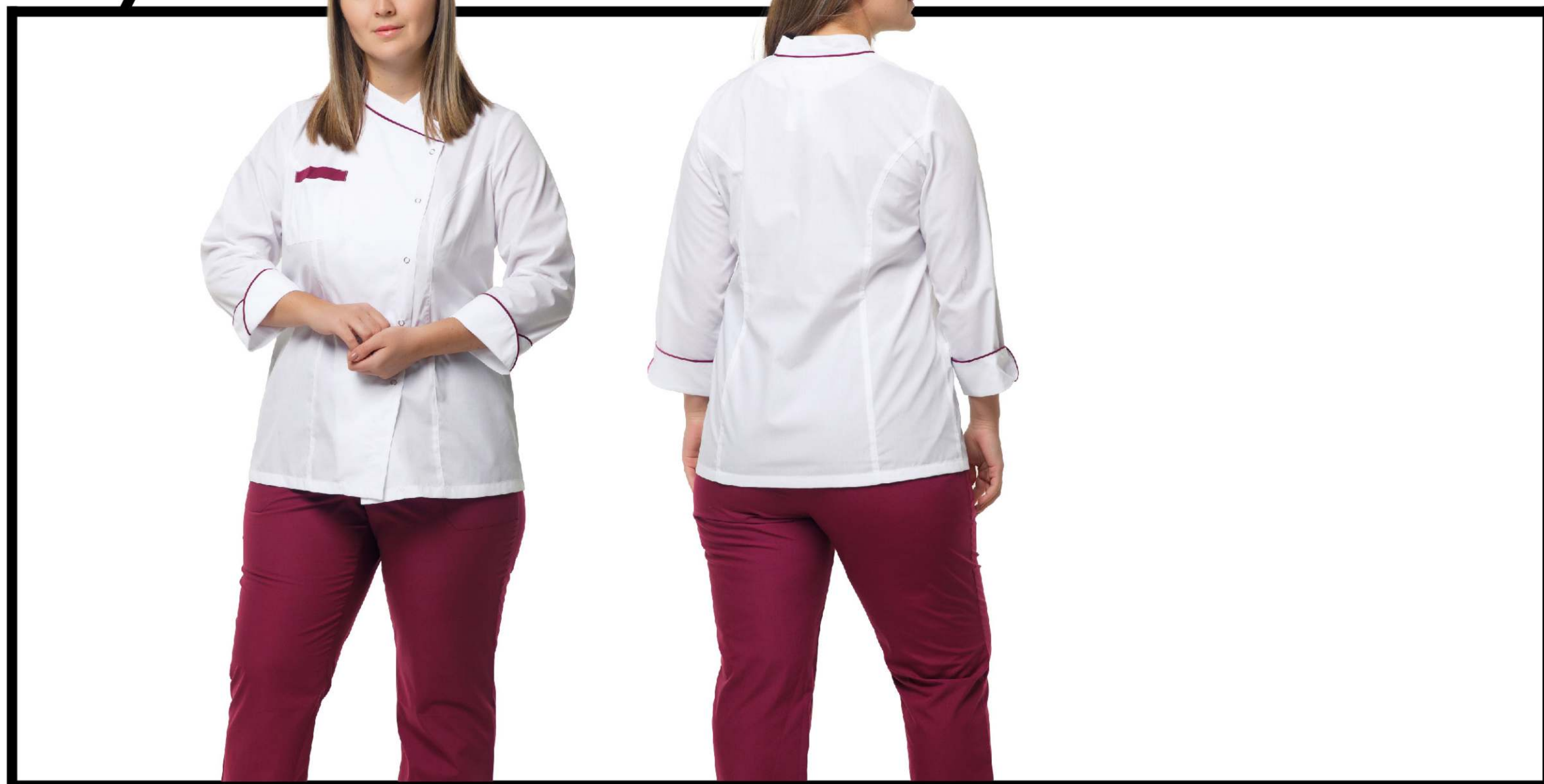
Арт. 2-696/1 Блуза женская