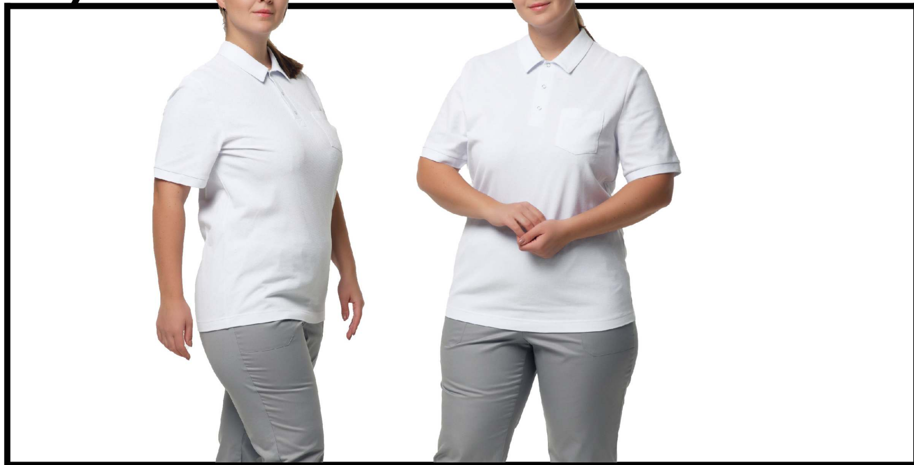
Арт. 2-871 Рубашка-поло