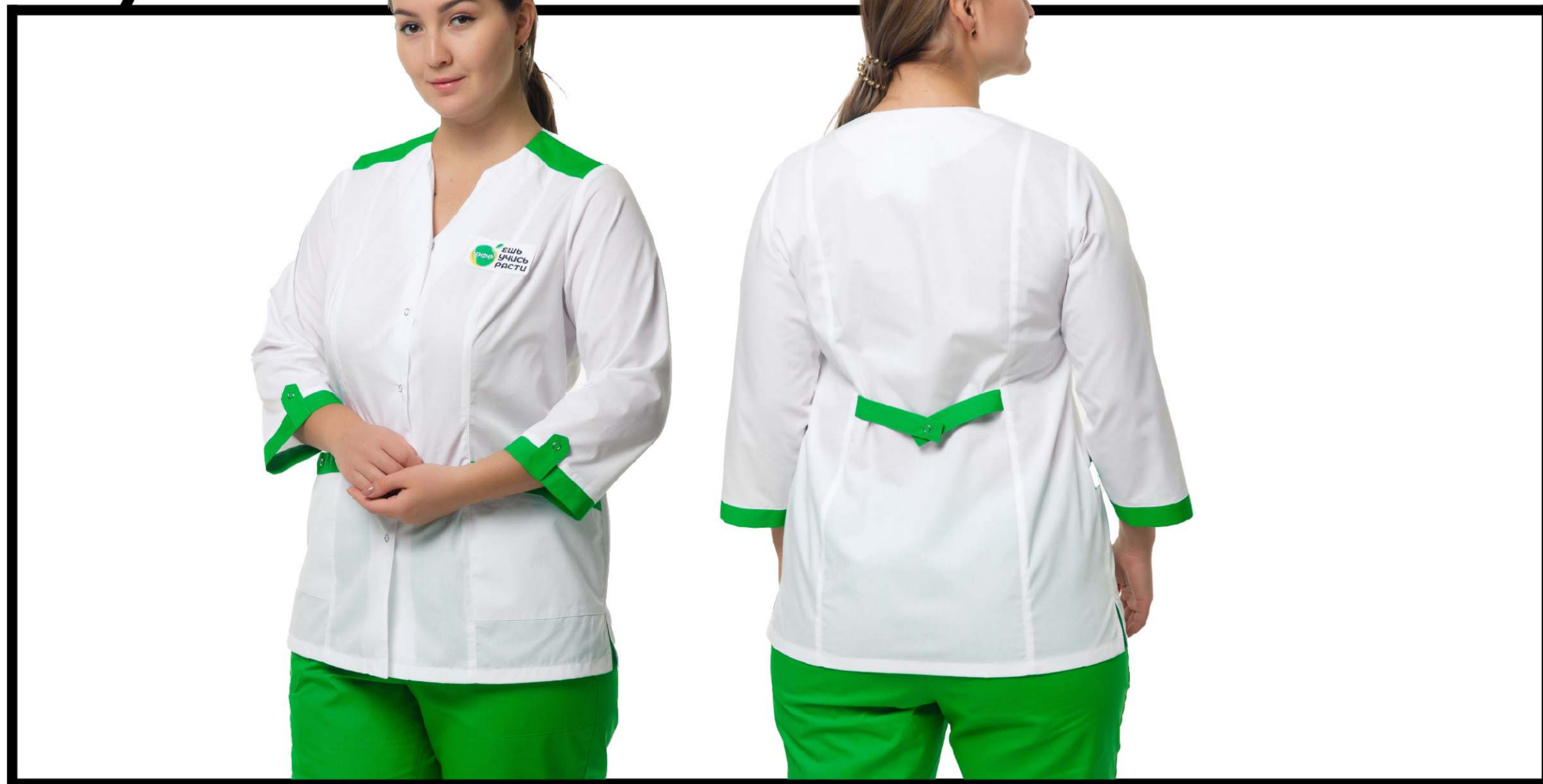
Арт. 2-606/1 Блуза женская