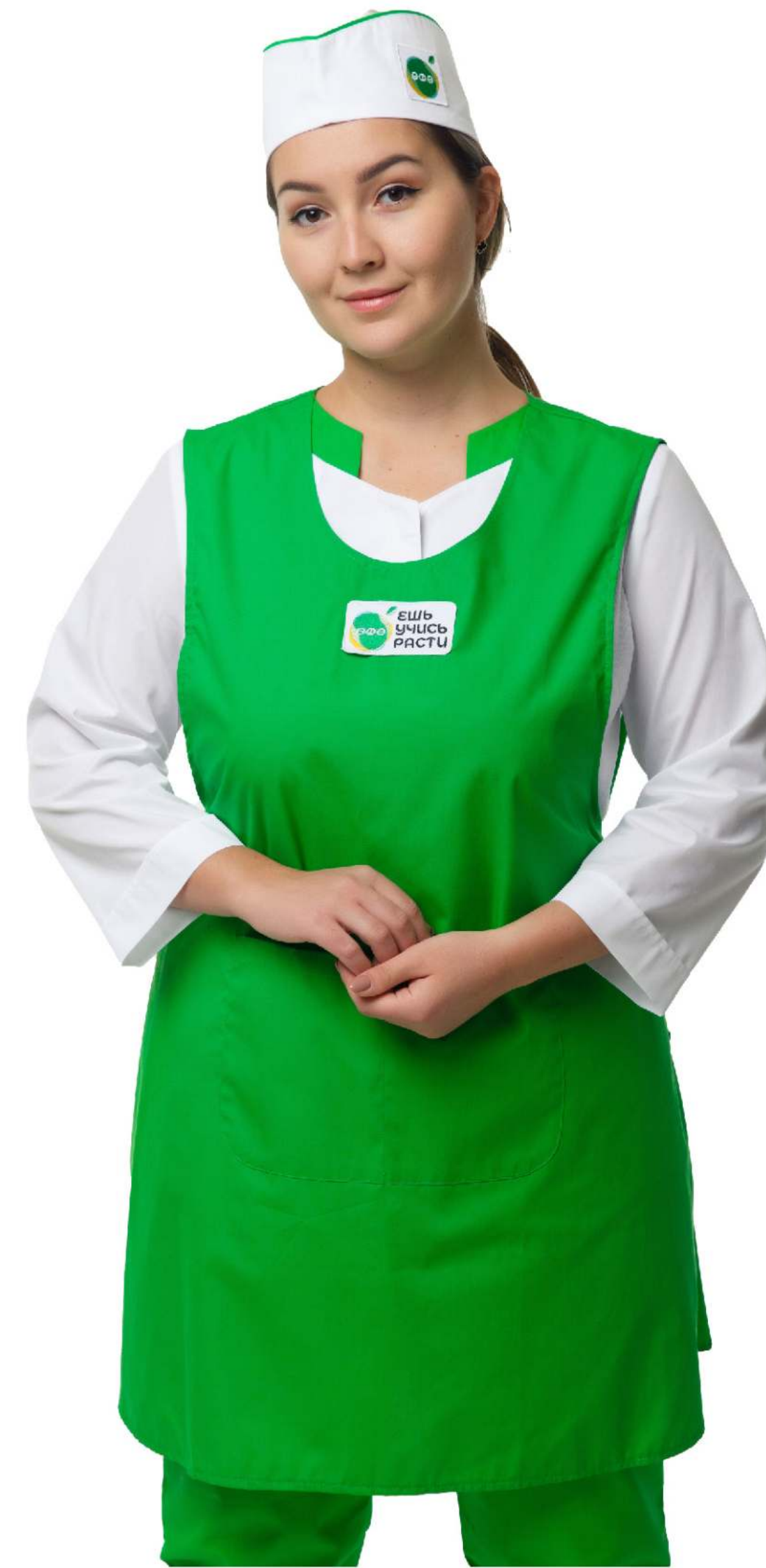
Размеры: с 44 по 54 Ткань: сатори