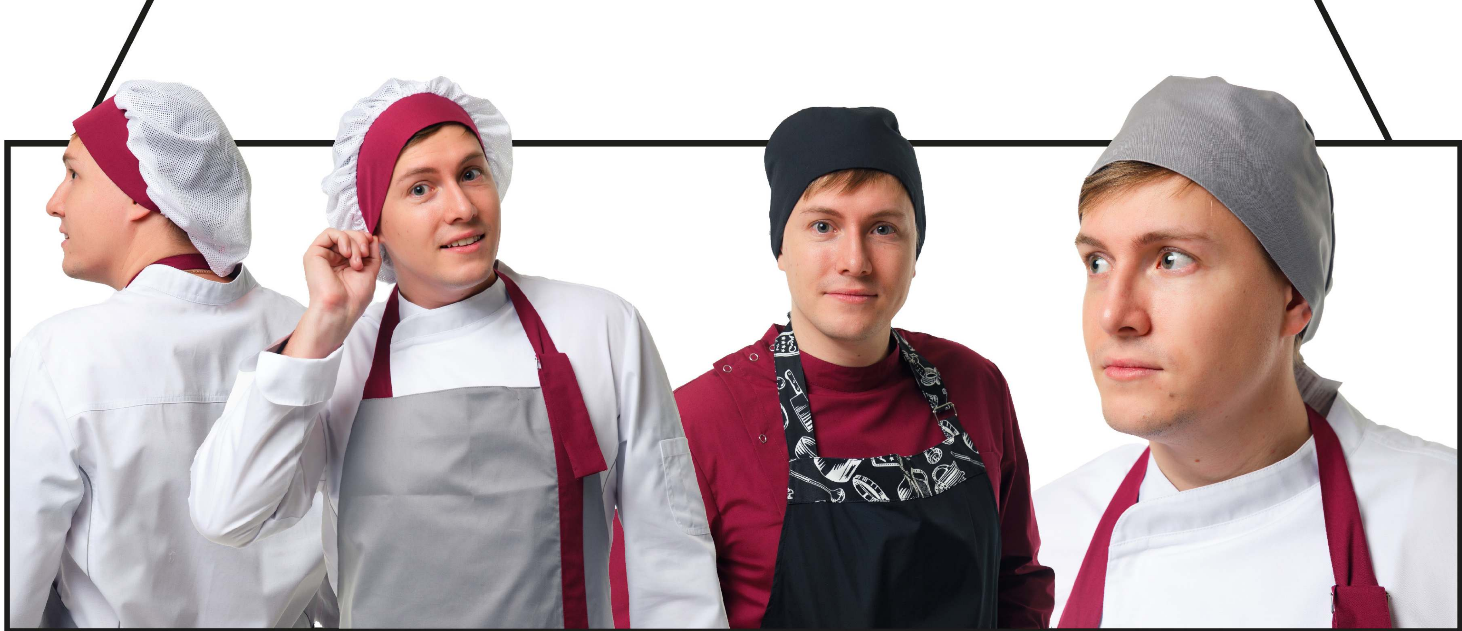
Арт. 4-856 Колпак поварской