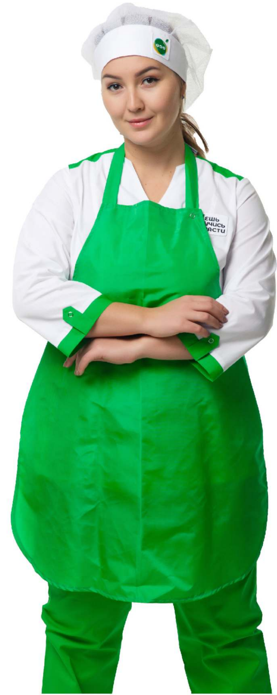
Размеры: с 44 по 54 Ткань: тиси