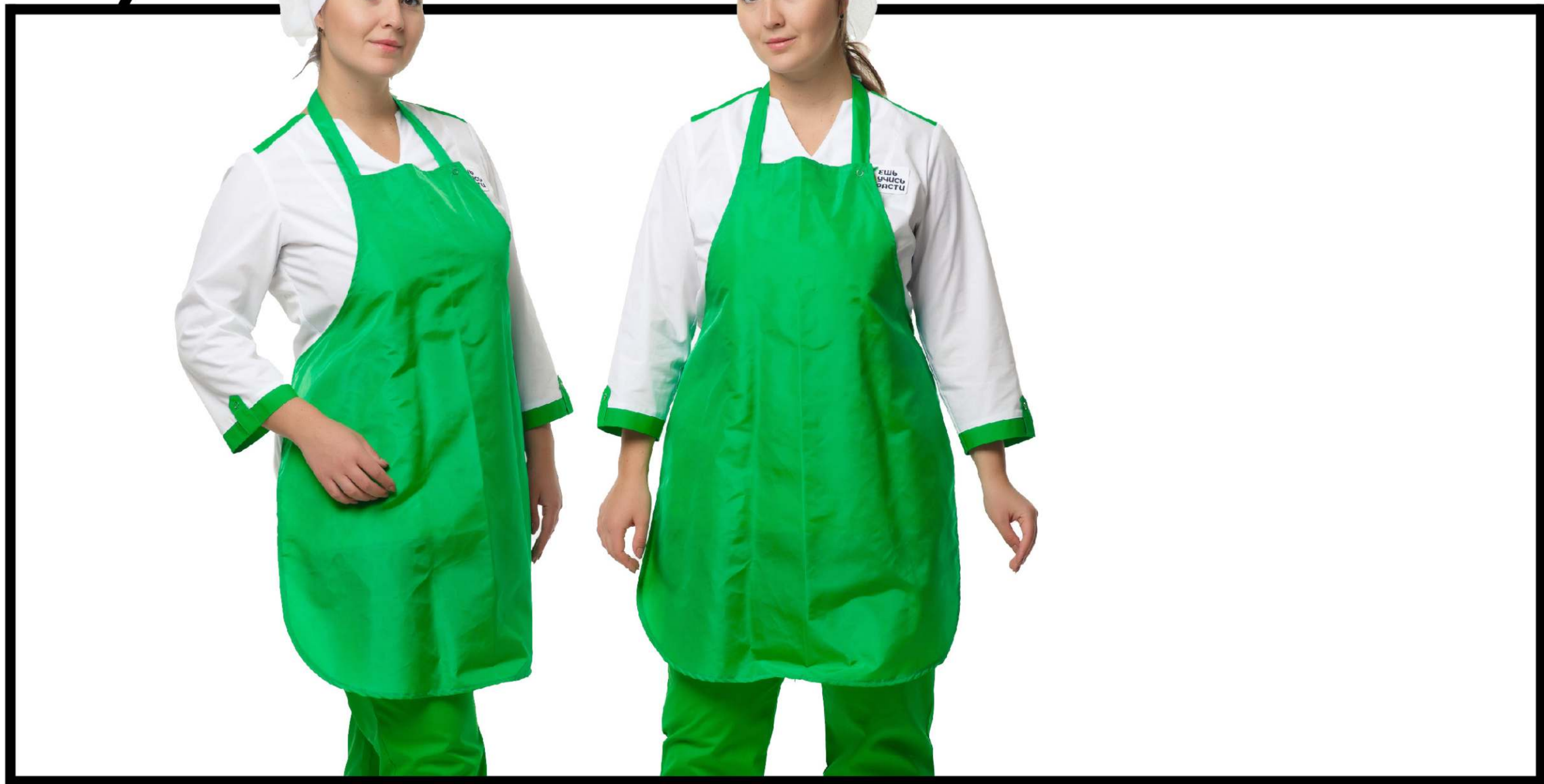
Арт. 5-116-5 Фартук