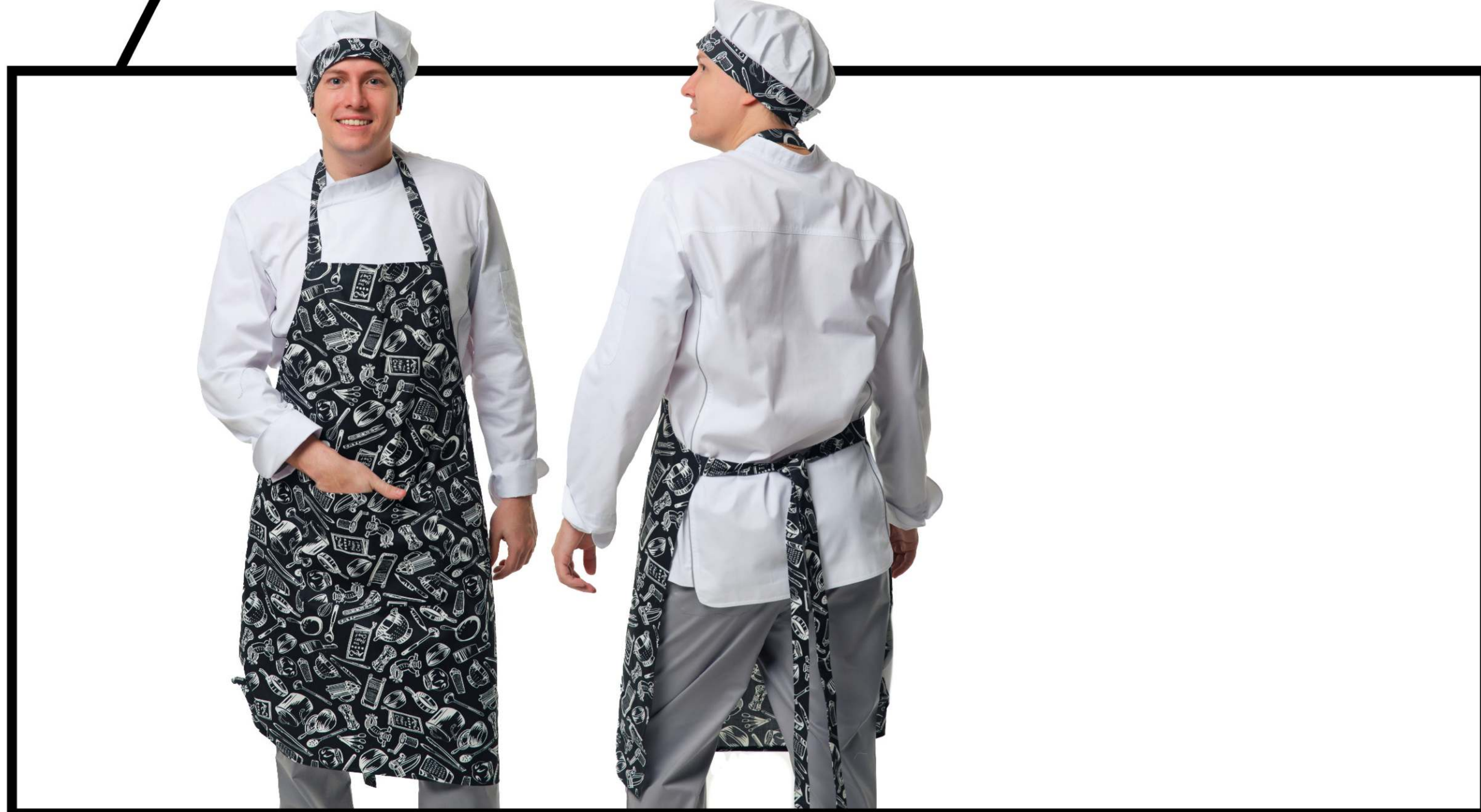
Арт. 5-775-1 Фартук