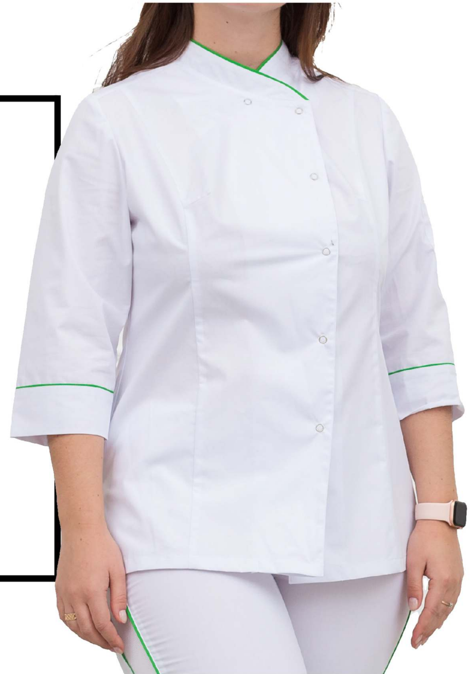
Арт. 2-696-2 Китель поварской