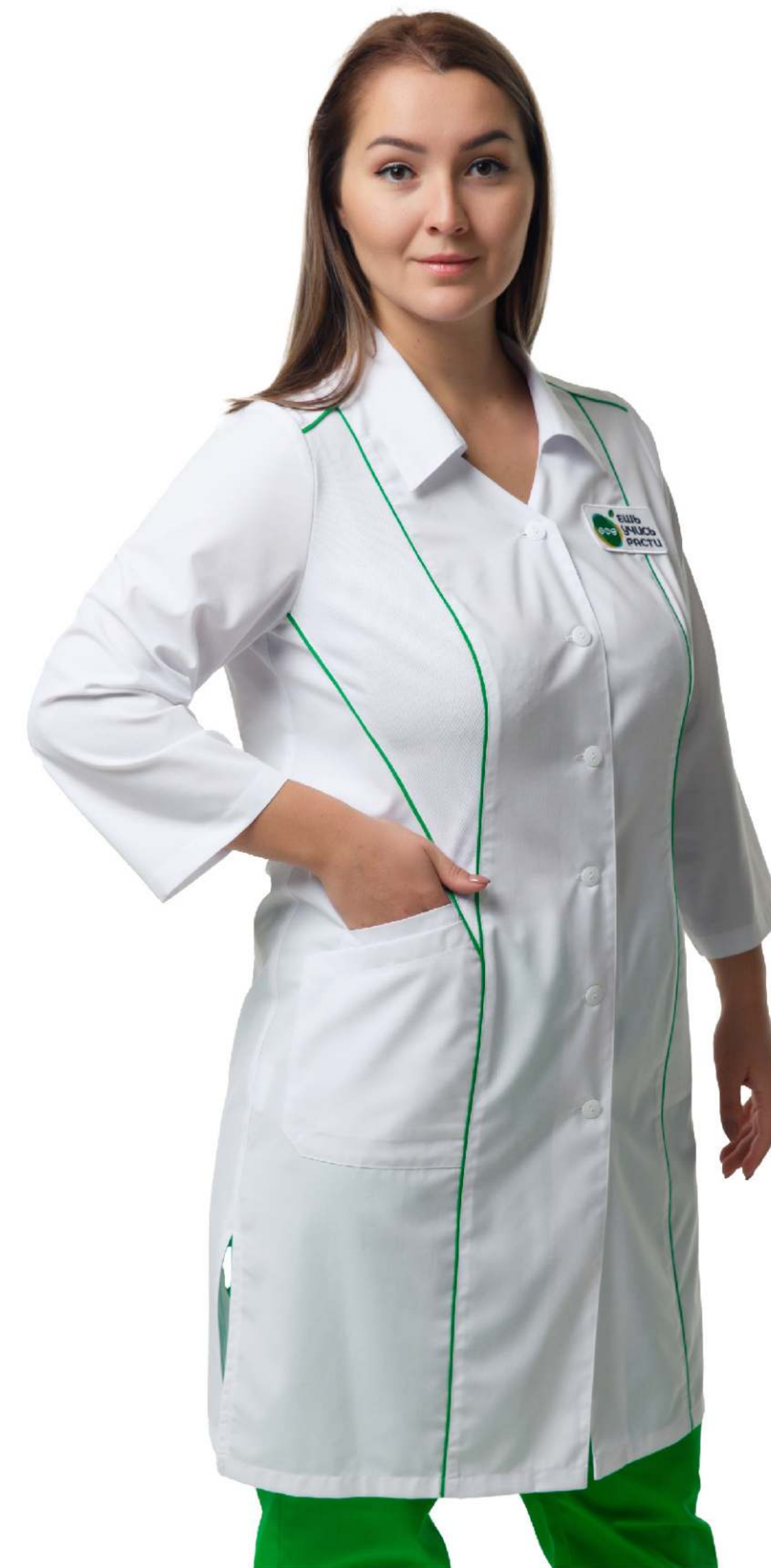
Размеры: с 44 по 60 Ткань: тиси, сатори