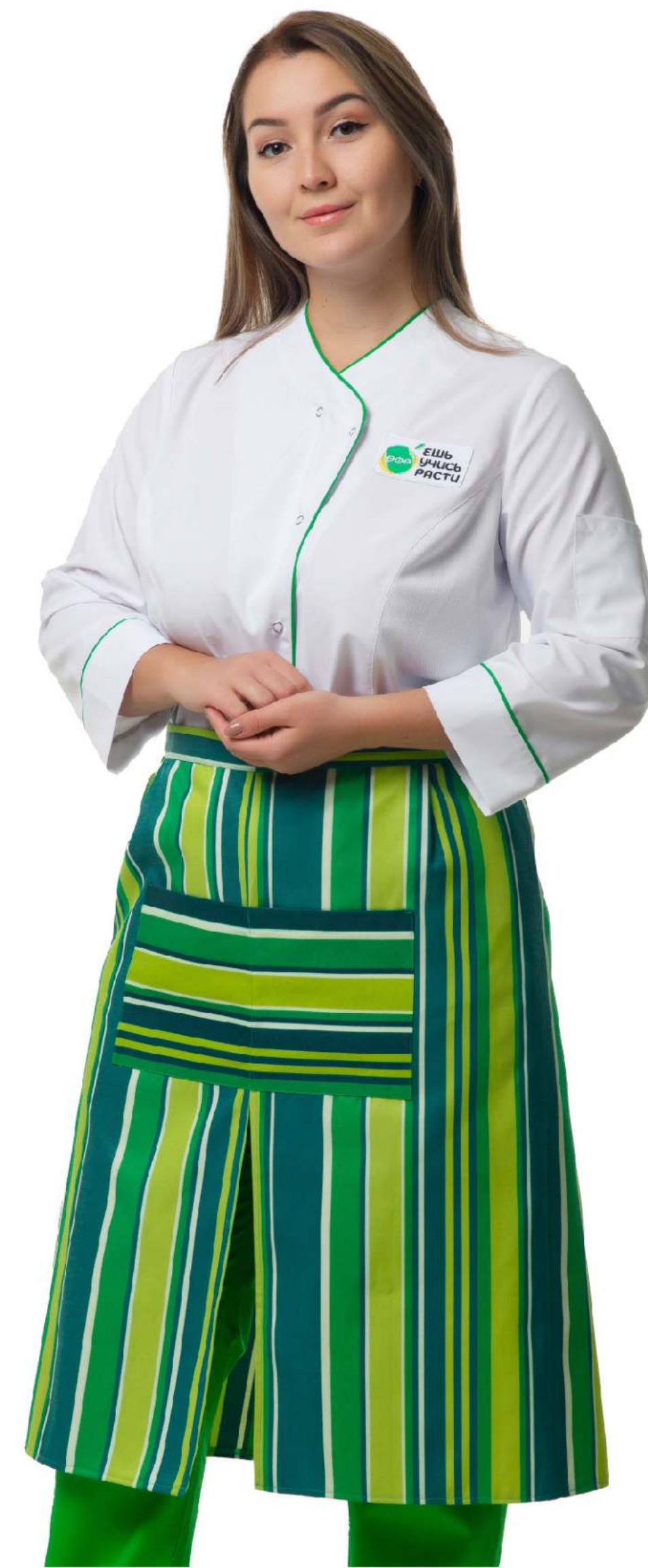
Размеры: с 40 по 48 Ткань: сатори