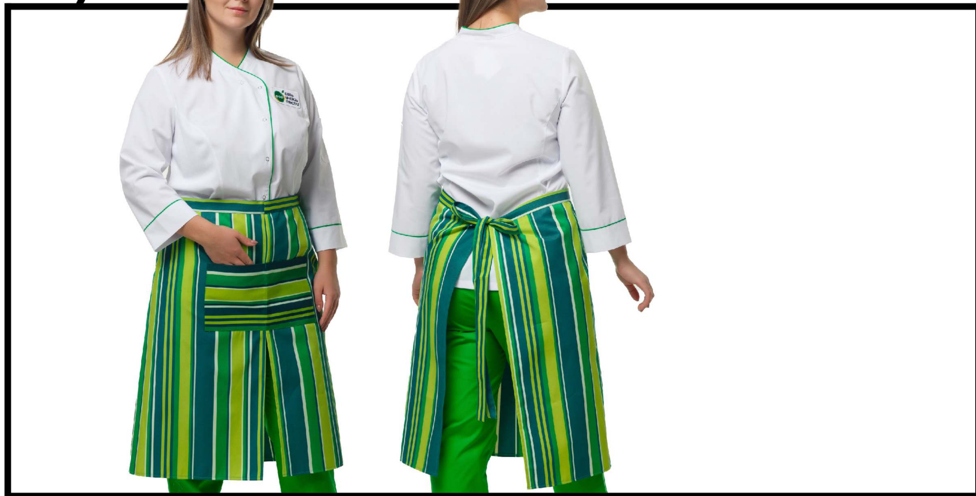
Арт. 5-356/1 Фартук на пояс