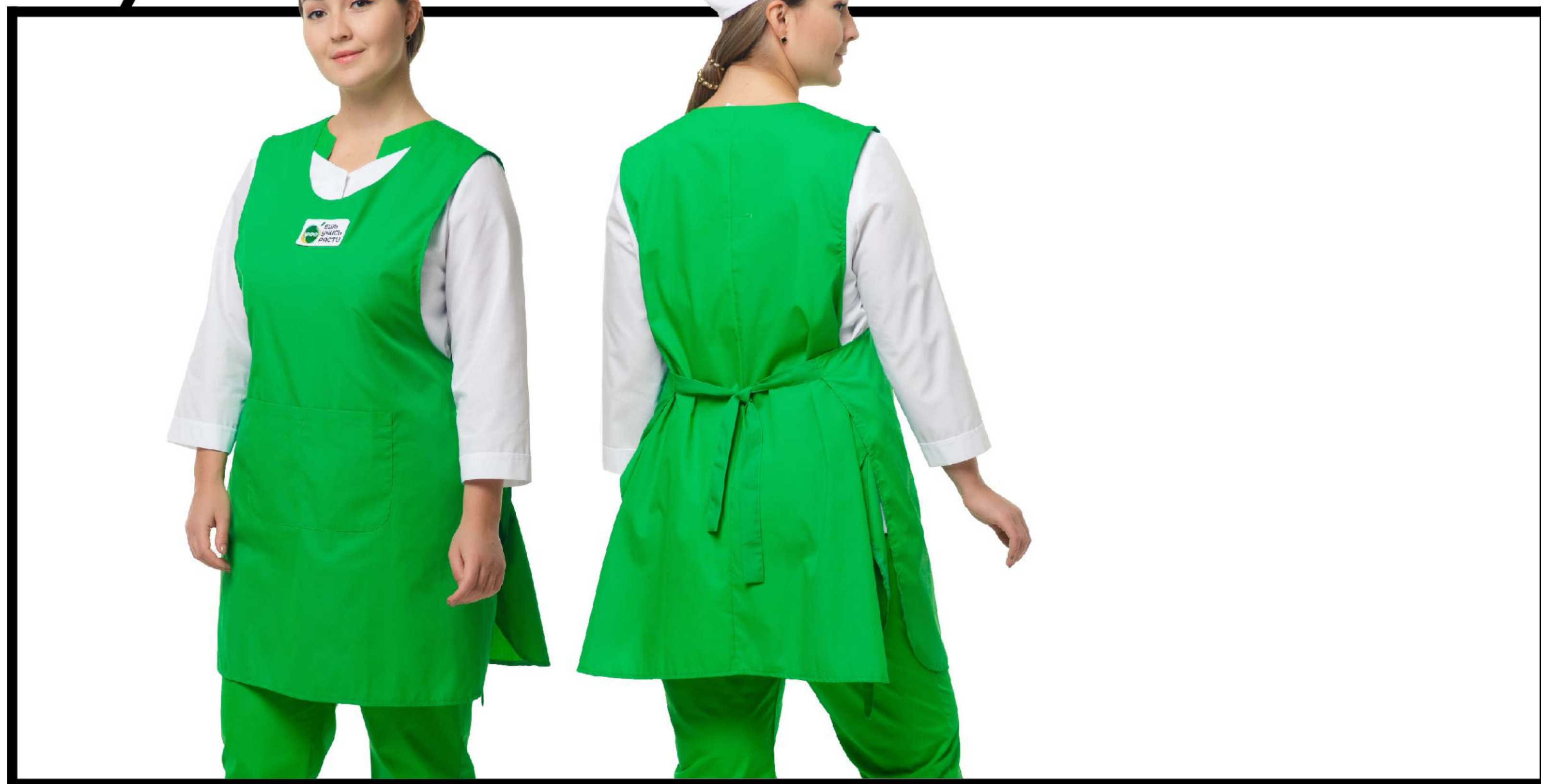
Арт. 5-71 Фартук