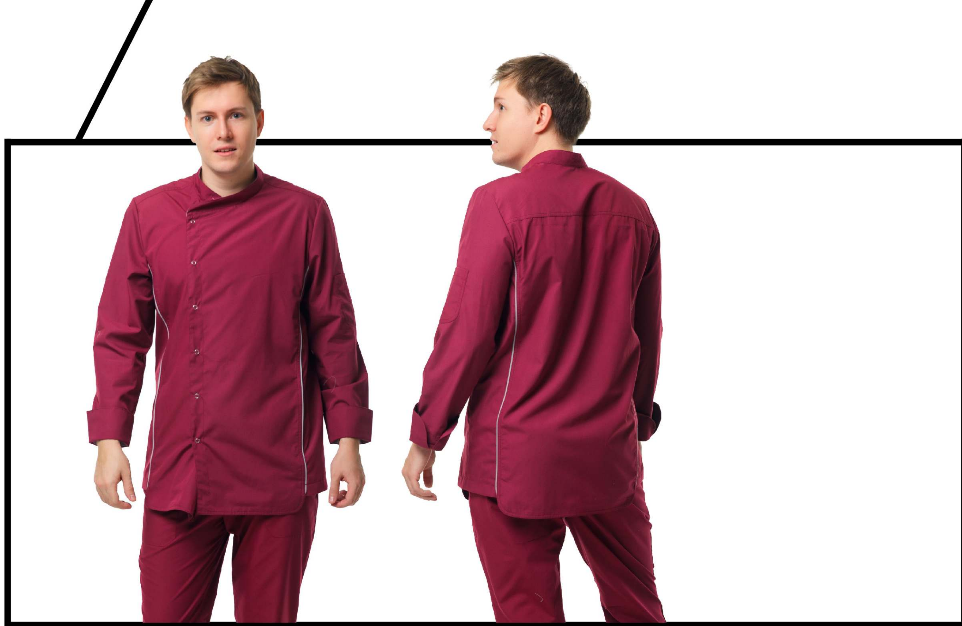
Арт. 2-643 Блуза мужская

Размеры: с 50 по 70 Ткань: сатори-стрейч