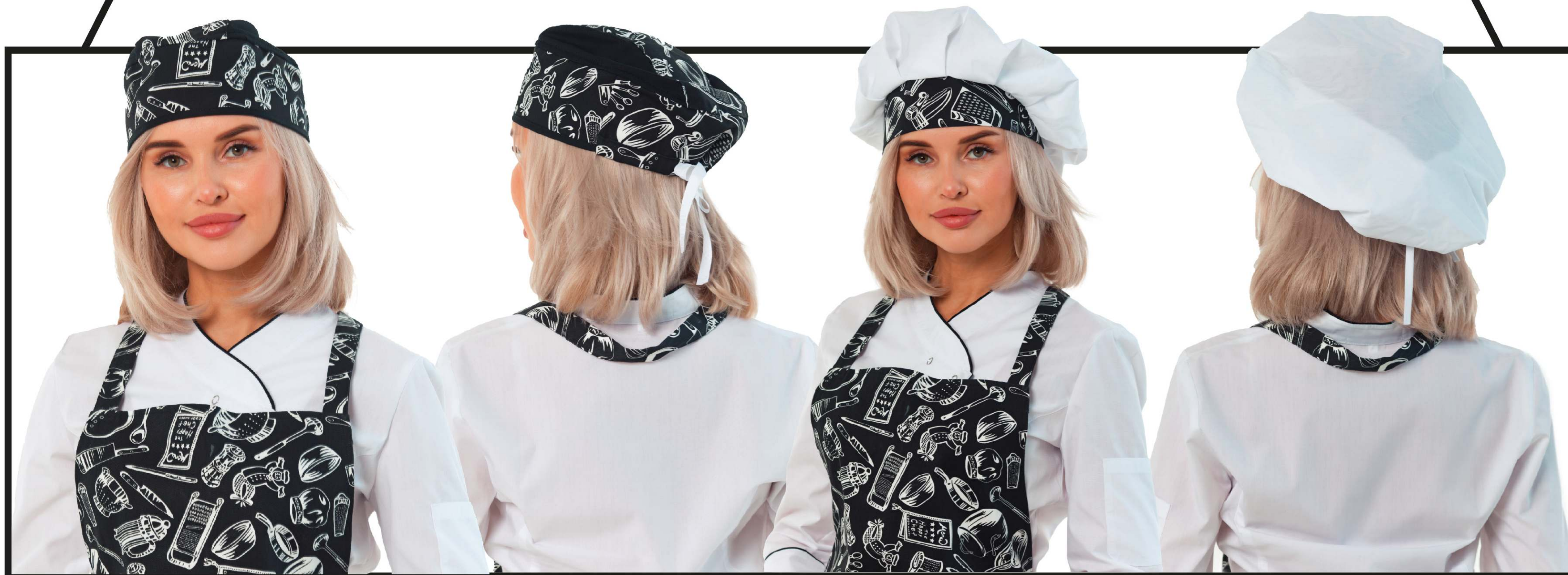
Арт. 5-722 Колпак поварской