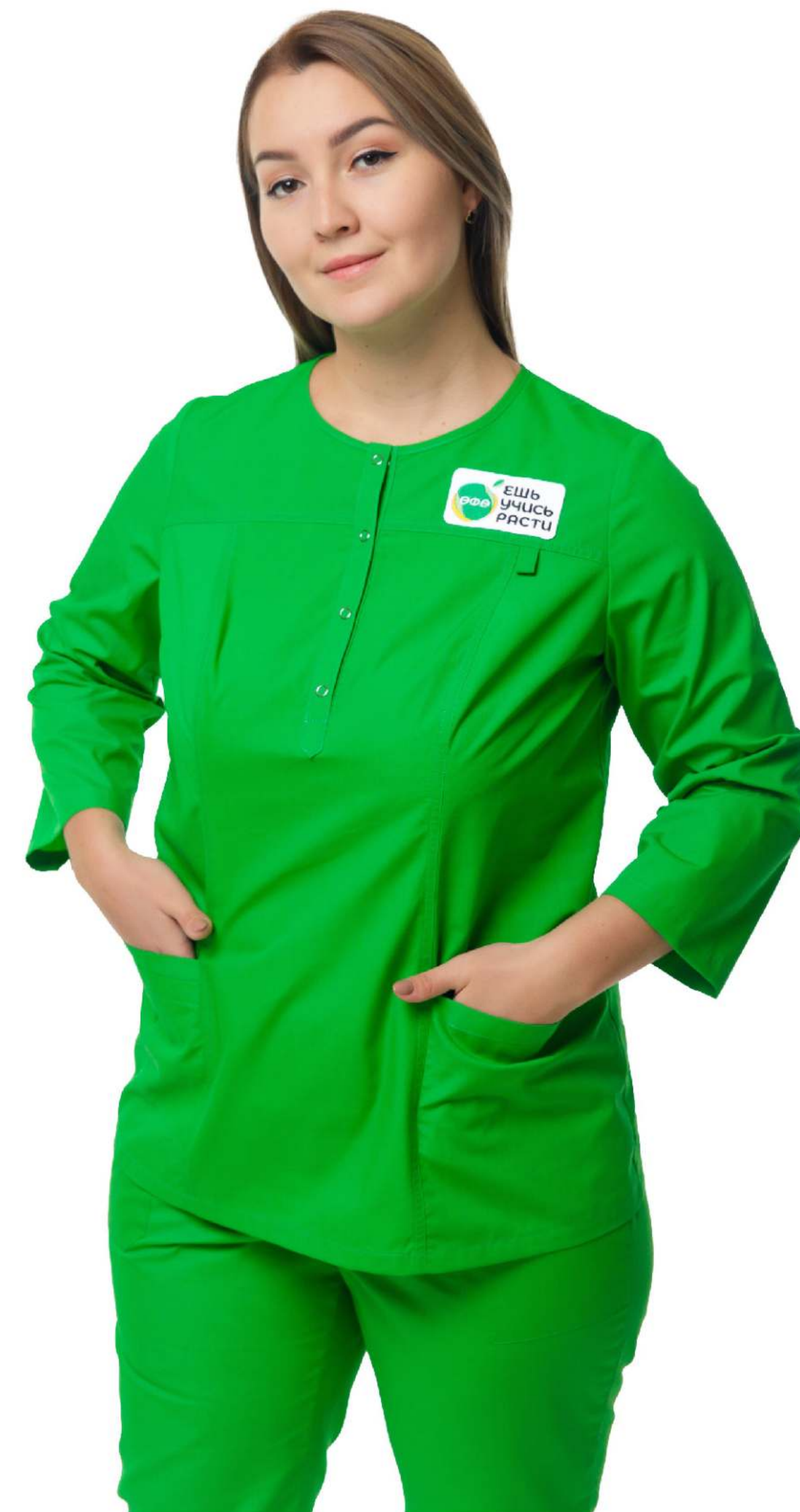
Арт. 2-716/1 Блуза женская